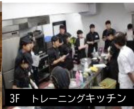
3F トレーニングキッチン