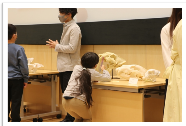
標本を熱心に観察してくれました！