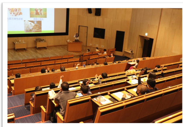
質問タイムにはたくさんの手が挙がりました！